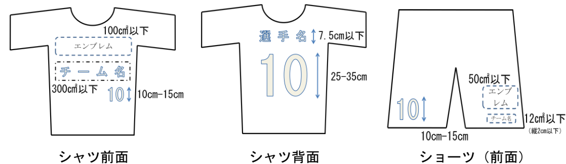
図1 <チーム識別標章(チーム名/エンブレム)及び選手番号のサイズ> (本規程 第5条(1)及び(2))